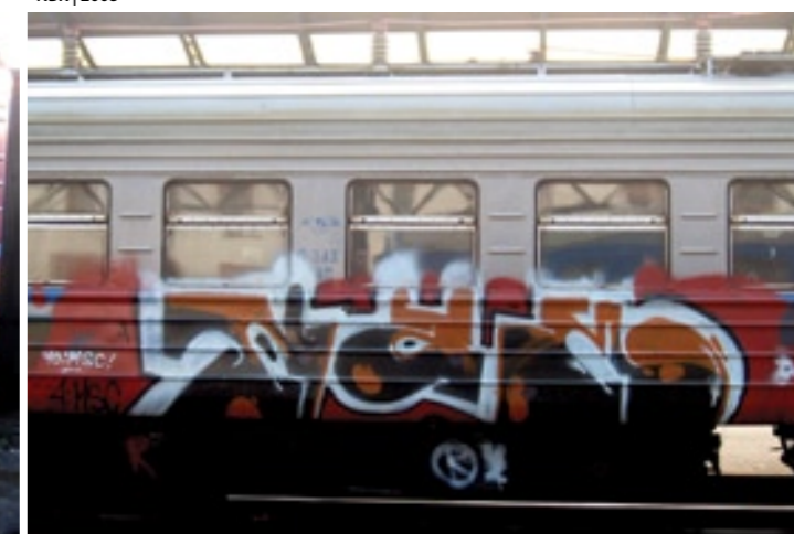
Nam2 (RUNS, MAK) | 2008