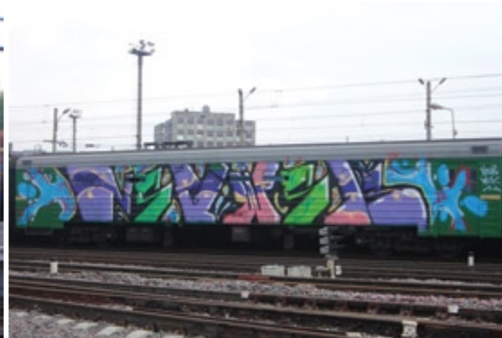
NSBWSK | 2008