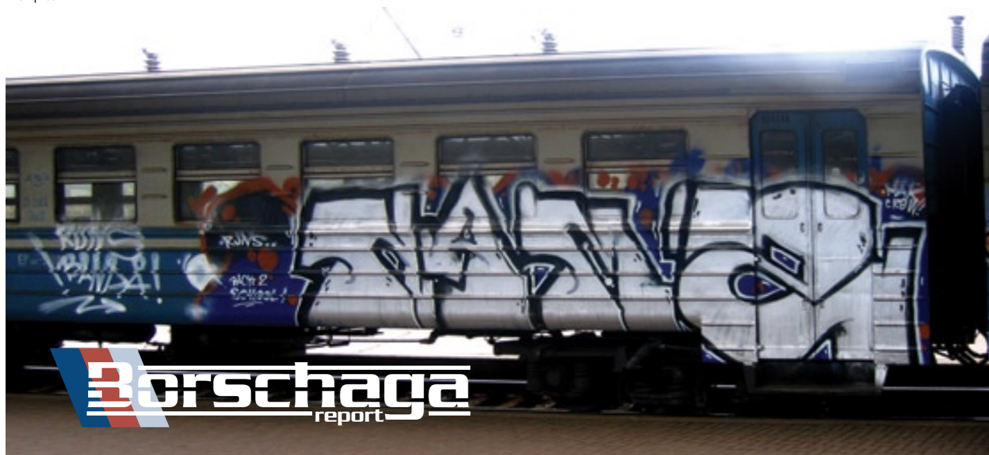
Nam2 (RUNS, MAK)