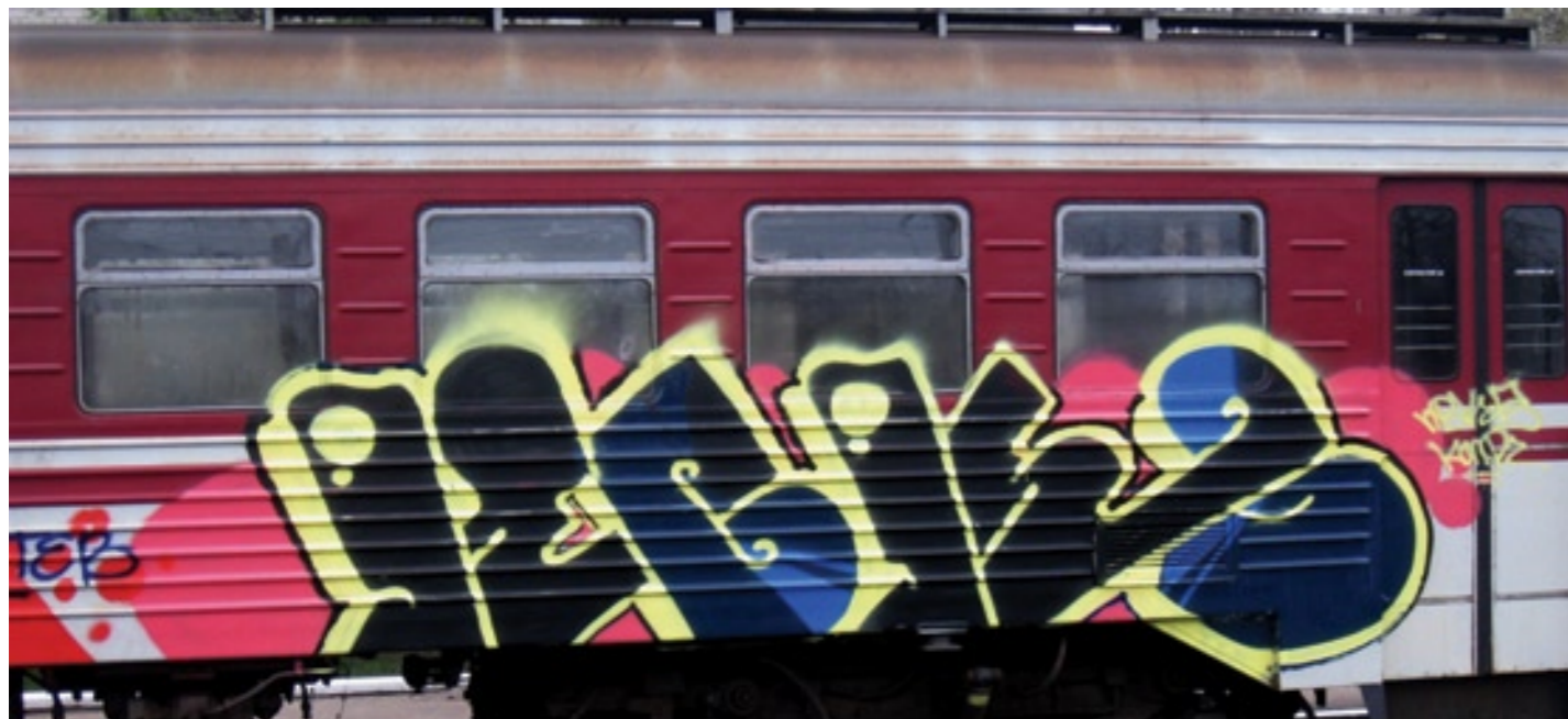
NBK | 2007