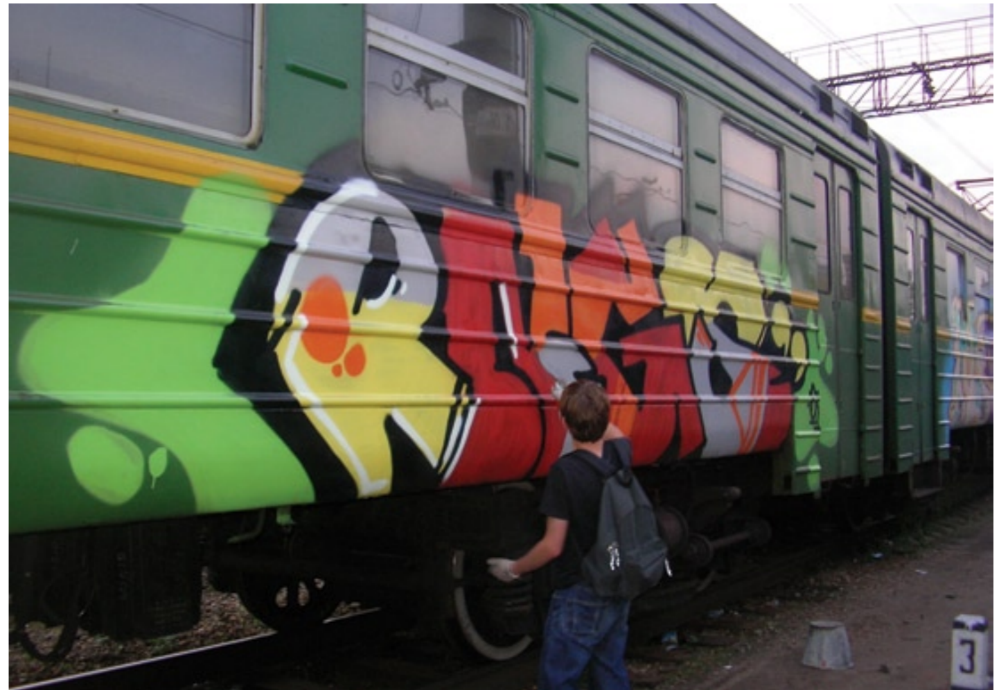
RNG (by Stom) | 2008