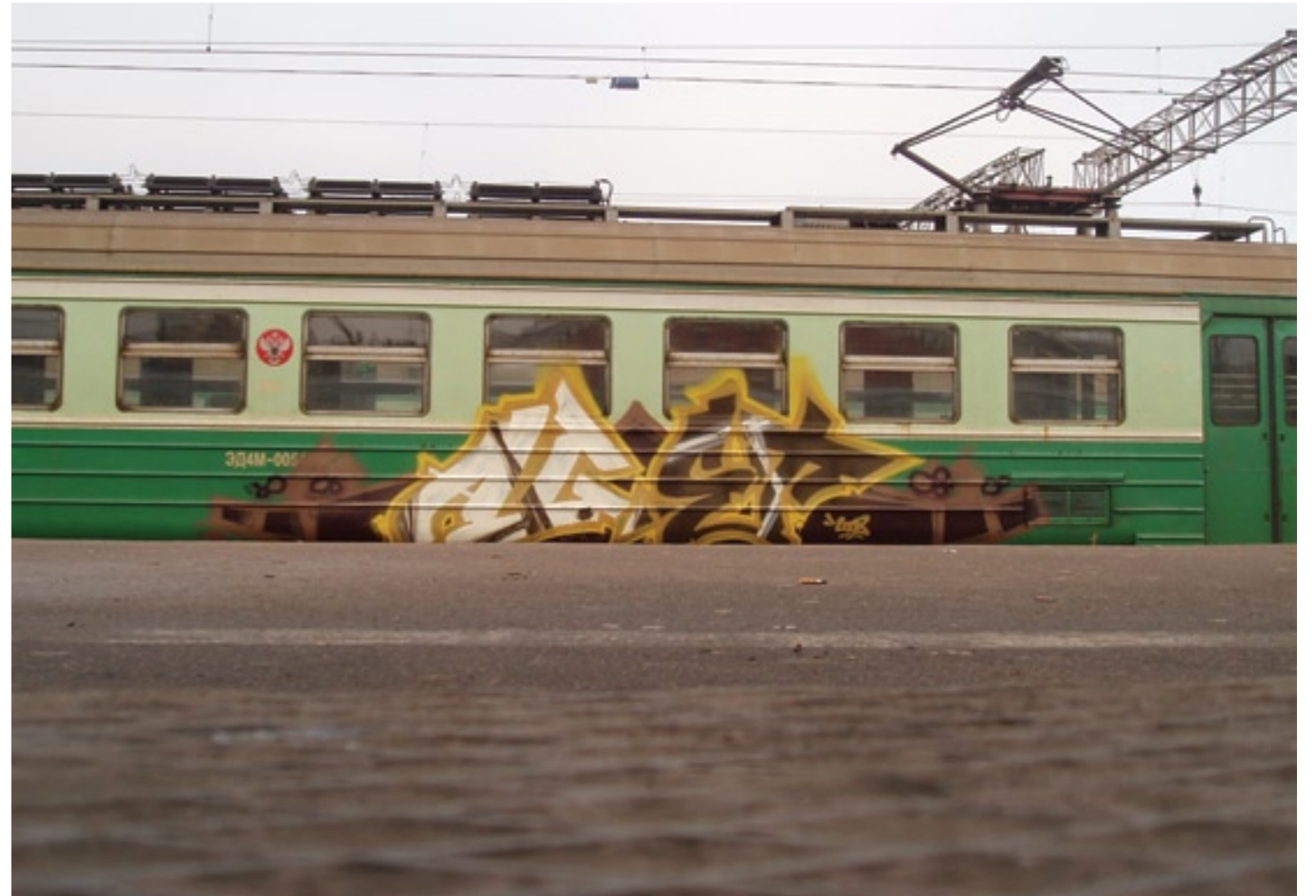
August (INFLUX) | 2008