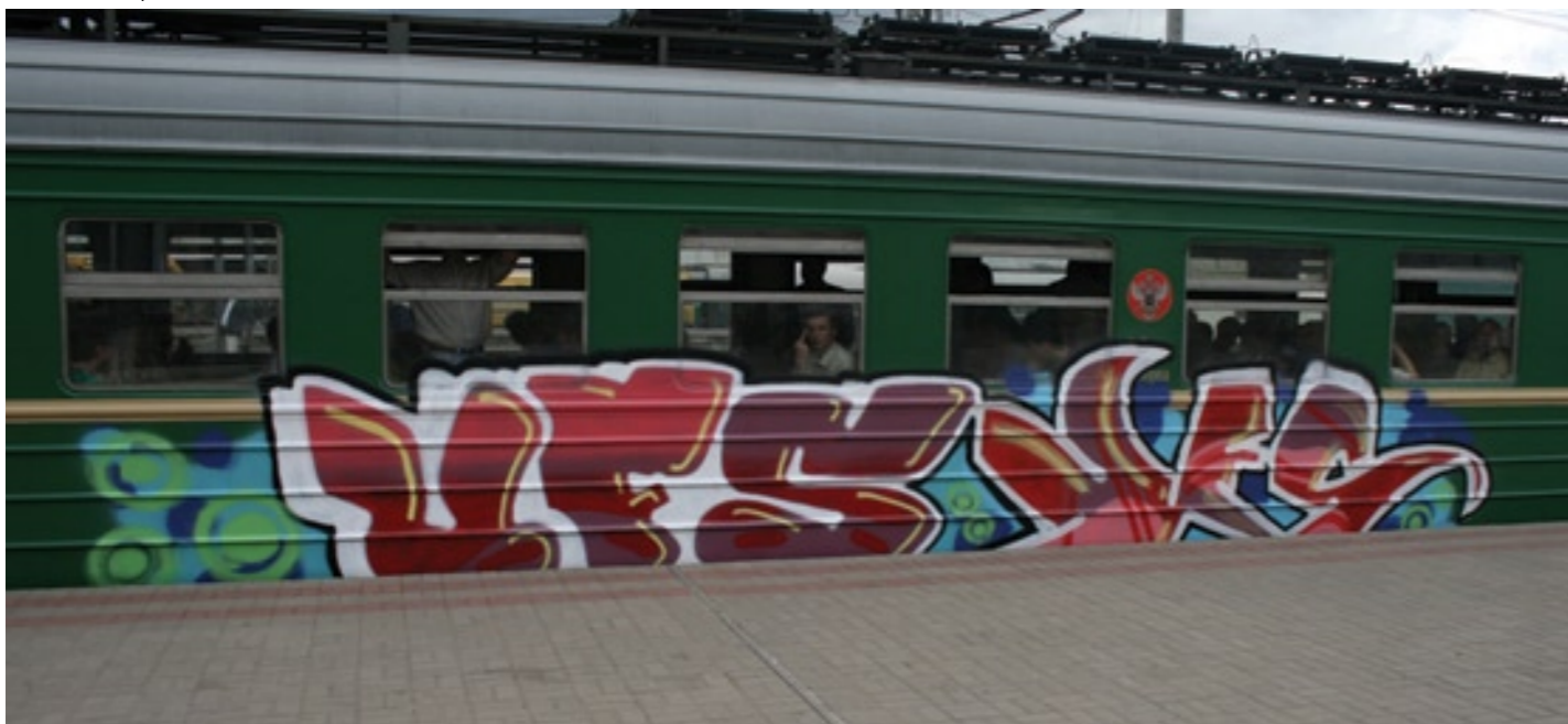
UFS (by Real), UFS (by Rais) | Moscow 2008