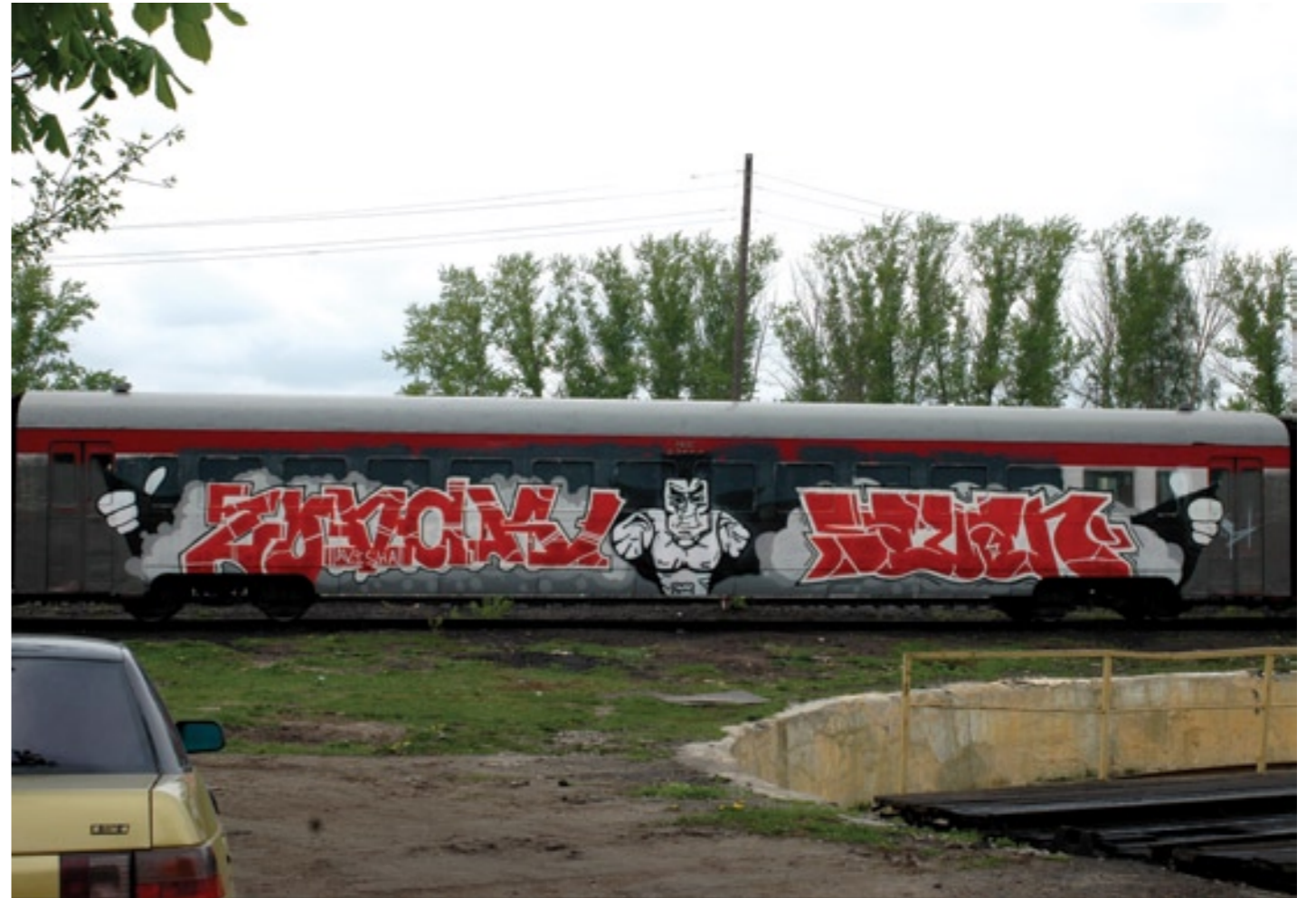
Zonck1 (TMP), Sayan (TMP) | Tula 2008