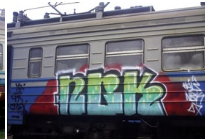
NBK | 2007