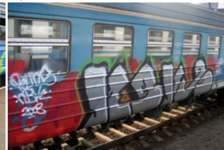
NBK | 2008