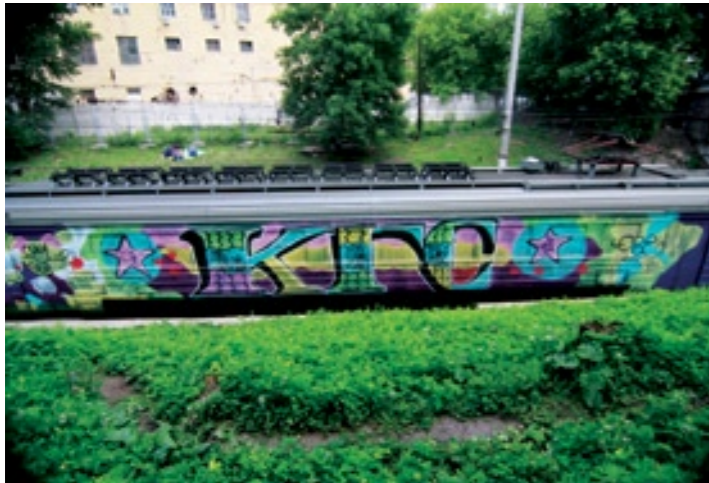
KG5 (by Quel) | Moscow 2008