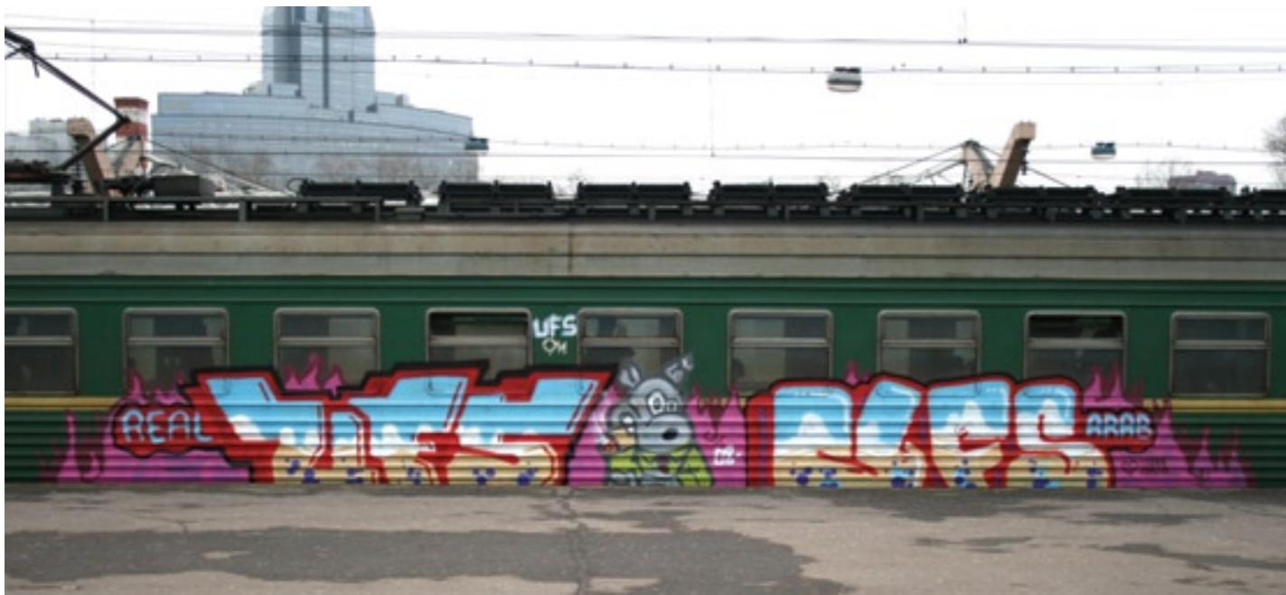
UFS (by Real), UFS (by Arab) | Moscow 2008