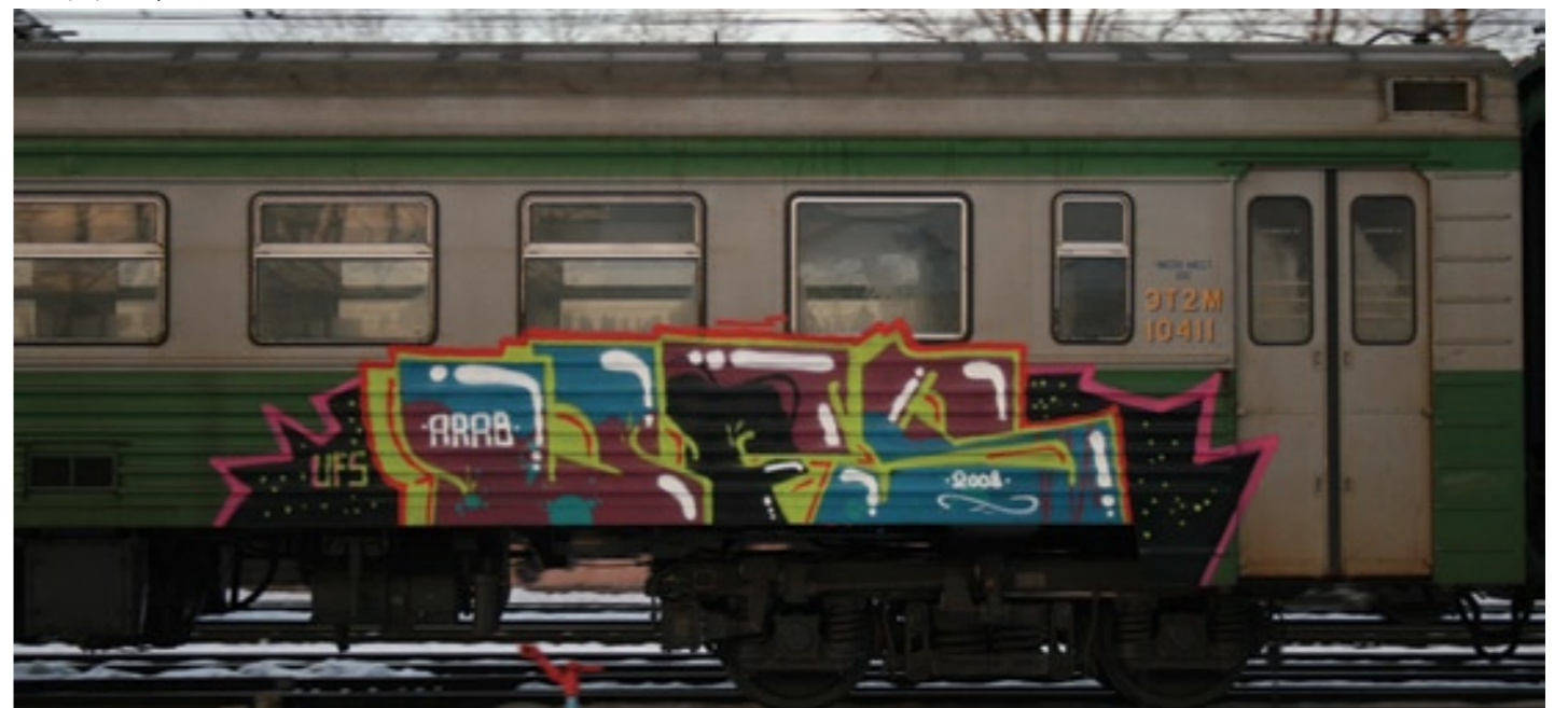
UFS (by Arab) | Moscow 2008