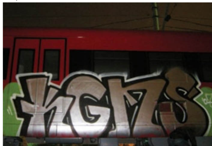
KGM | Moscow 2007