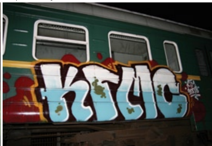
KGM | Bryansk 2008

Помню, Rock когда-то сказал – «Сте, твой стиль не похож ни на кого» Стремился ли ты, чтобы так было, или становление твоего стиля – это влияние каких-то других факторов?