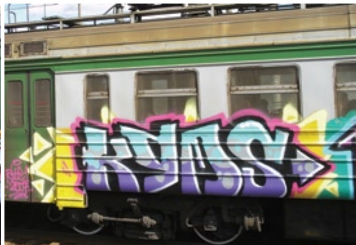
KGM | Saint-Petersburg 2007