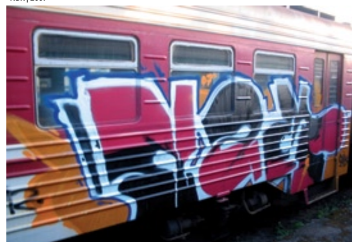
Nam2 (RUNS, MAK) | 2007