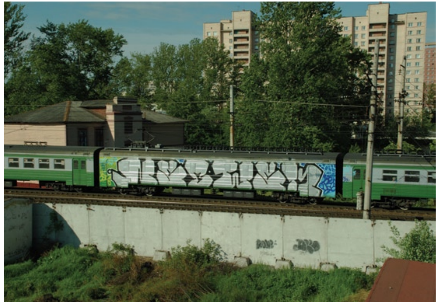
NSBWSK (by Sero, T3ks & Bla) | Moscow 2008