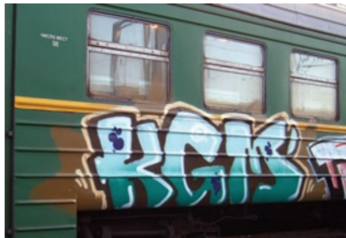
KGM | Kostroma 2008

В планах был только Питер. Там всегда были, есть и будут свои веселые и надежные люди. Пользуясь случаем, я предложил моему старому другу Карлосу эту идею. Дальше уже все само собой получилось. А Киевский филиал появился довольно случайно, но сегодня я не жалею об этом. Можно отметить, что подобной практики на российской сцене до нас не было. Что же будет дальше – прогнозировать сложно, да и ни к чему. Но если будут достойные кандидатуры, мы обязательно их обсудим.