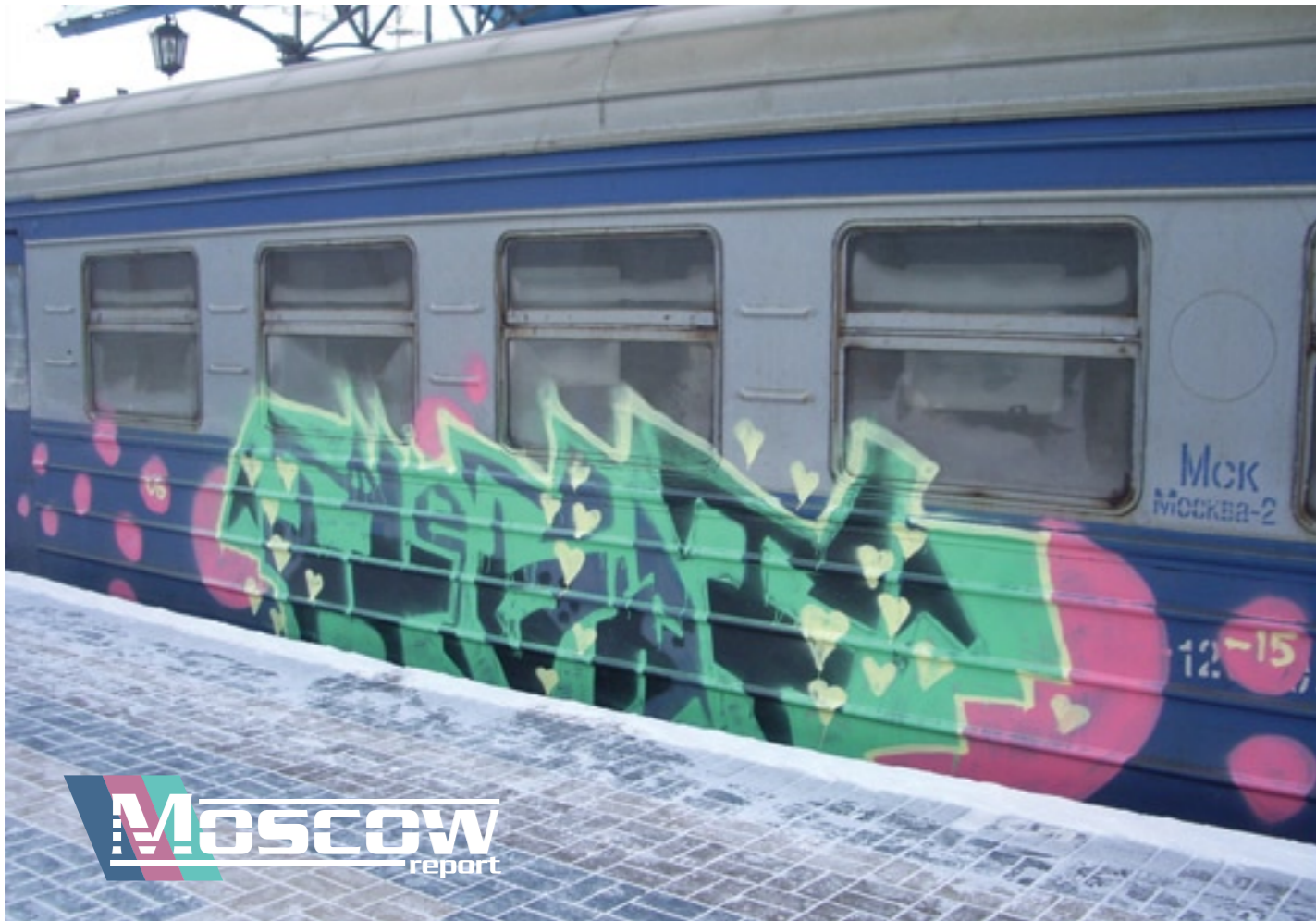
Debut (RNG) | 2006