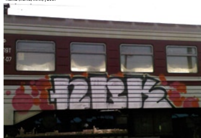
NBK | 2007