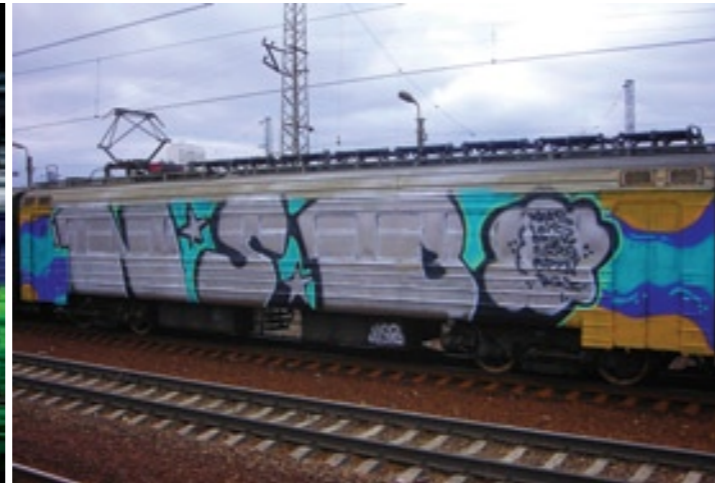
NSB (by Xmas & Lois) | Moscow 2008