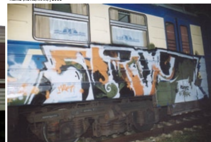
Nam2 (RUNS, MAK) | 2006