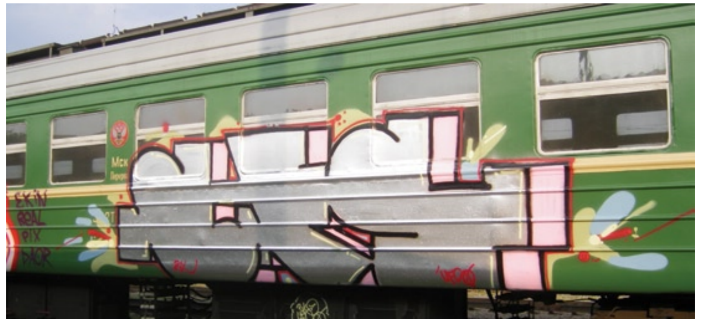
UFS | Moscow 2008