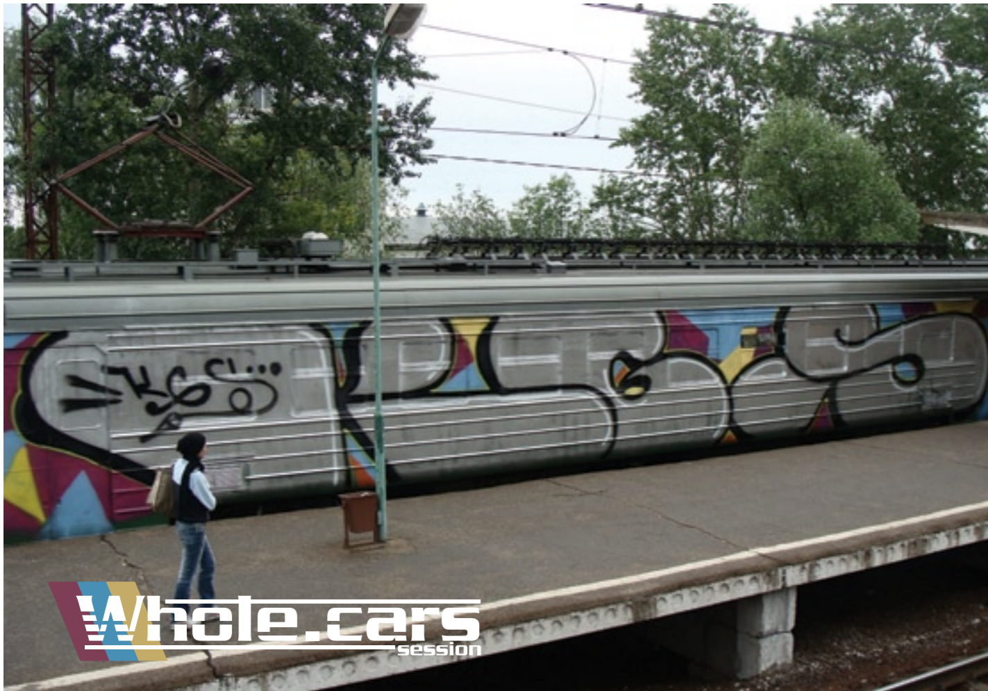
KG5 (by Tear) | Moscow 2008