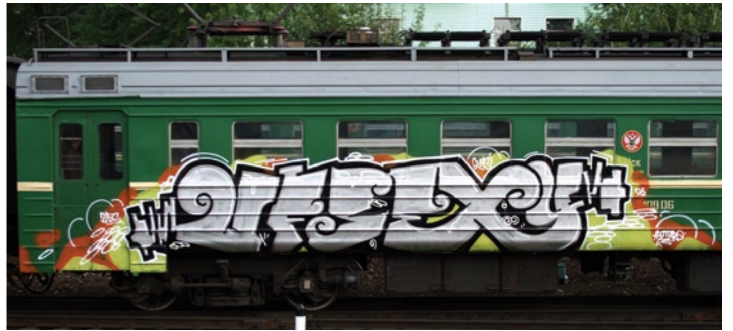
UF5exy (by Petro) | Moscow 2008