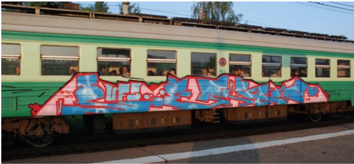
Petro (UFS, AES) | Moscow 2008