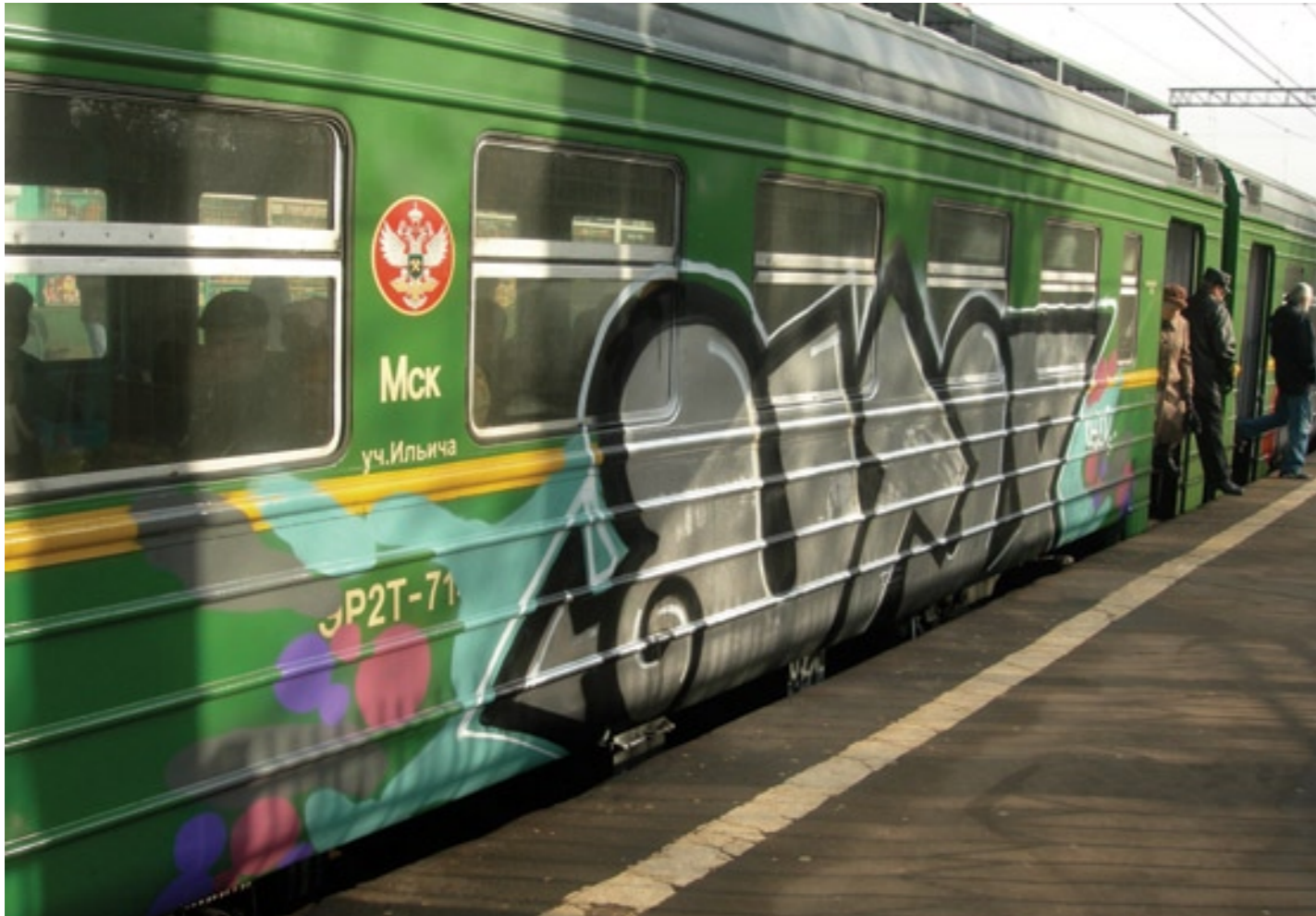
UTOP (by Skul, Bruk & Puto) | 2008