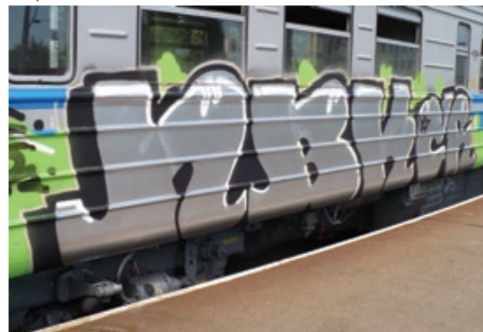
NBK | 2007