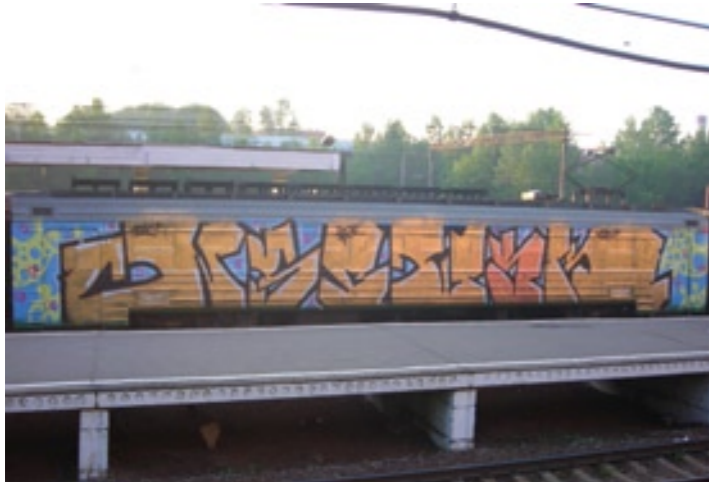
NSBWSK (by Xmas, Lois, Abek & T3ks) | Moscow 2008