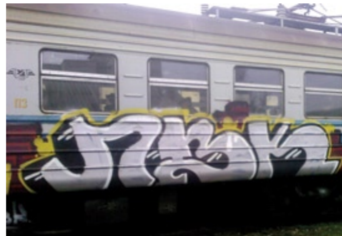
NBK | 2007

Пришли туда днем, начали рисовать цветные куски, кто-то заметил палево, все разбежались... Я замешкался с камерой возле забора, не понимая, в чем причина. Начиная перелезать через забор, поворачиваю голову – рядом с недоделанными кусками стоит мужик в гражданском, достает ствол и спокойно так говорит: “Иди сюда”. Адреналин перебрал меня через забор, камера выпала из сумки прямо на асфальт... ну, дальше понятно.